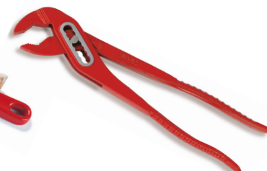
Vízpumpákhoz való kulcsok