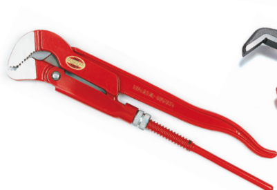
Két fogantyús kulcsok