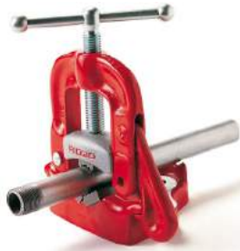
Munkapadra rögzíthető kengyeles satu