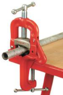
Hordozható kengyeles satu