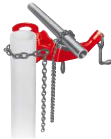
Csavaros feszítésű, oszlopra rögzíthető láncos satu